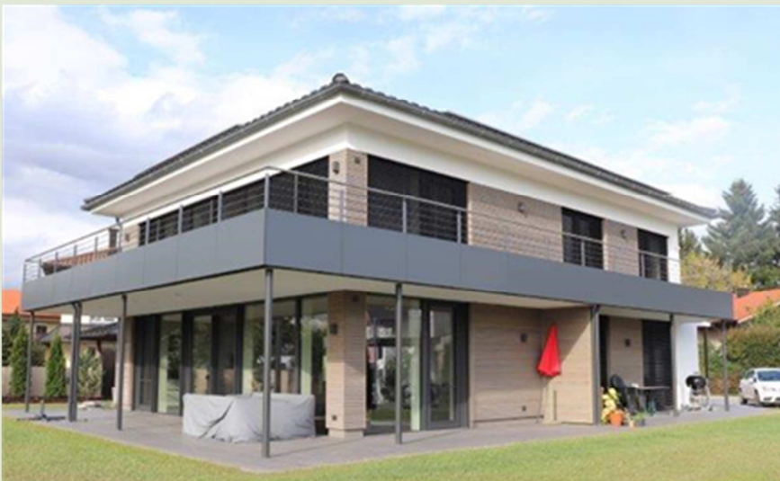
Haus Föttinger in 83308 Trostberg, Dr.-Paul-Töpfer-Straße 6

Passivhaus Gruber Inh. Manfred Gruber Haid 10 84558 Kirchweidach